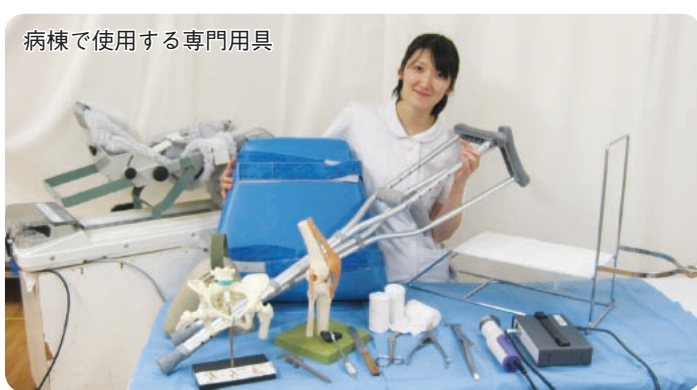
病棟で使用する専門用具

ものになるように、地域のリハビリ病院と連携をとり、スムーズな転院をご案内しています。この取り組みにより、患者さんがリハビリに十分専念出来る時間が持てるようになりました。車椅子や松葉杖で退院や転院された患者さんが、歩いて病棟に顔を出してくれる事が私達スタッフの励みになっています。転倒や怪我はいつ誰にでも起こりうる事です。そういった不慮の事態に対し、私達スタッフ一同は患者さんの思いに寄り添い、患者さん自身の日常生活動作の自立を目指していけるように、全力でサポート致します。