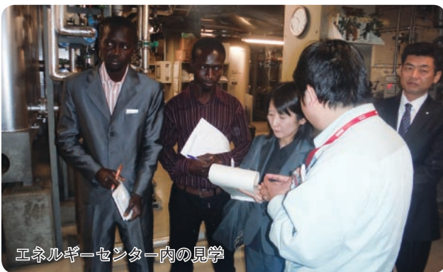
エネルギーセンター内の見学

備(エネルギーセンター棟、消防設備、空調設備等)の見学を通じて、施設の維持管理について学んでいただきました。研修員の方たちは母国の職業訓練所にて指導員として求職者等の指導にあたるそうです。