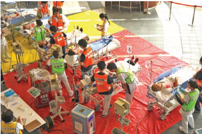
当院ロビーを利用した災害医療地域連携訓練