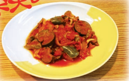
1人分84kcal・塩分1.1g・野菜150g 町田市民病院栄養科：杉山