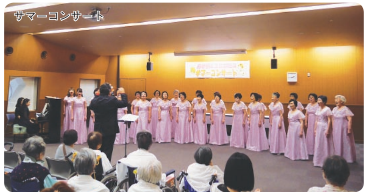
サマーコンサート

コンサートは毎年夏と冬に行われているもので、入院患者さんを中心に約60名の方が来場されました。コミカルな歌や町田市民の歌「ふるさと町田よ」などを選曲していただき、最後は全員で「アン