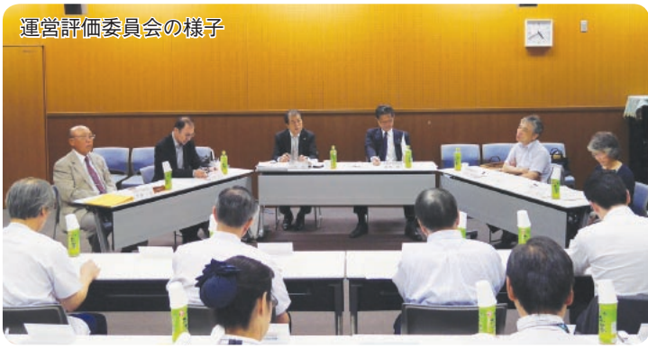
運営評価委員会の様子

2015年度第1回町田市病院事業運営評価委員会を6月18日(木)に開催し、2014年度の決算見込や中期経営計画の進捗状況、2015年度の病院事業計画について説明しました。委員からは「救急医療に関する目標値として、救