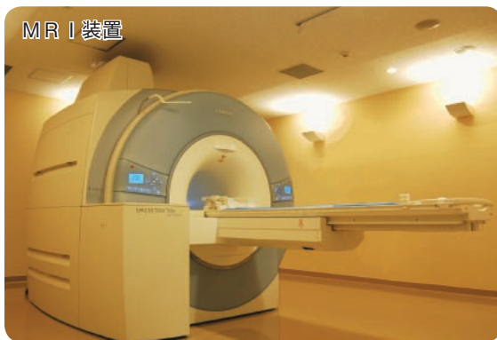
MR I 装置 お気軽に放射線科受付（被ばく説明担当）までお問合せ下さい。

ばくに関する相談が増えました。放射線は目に見えないので、「恐ろしいもの」「ガンになるのでは」と不安に思う人が多いのではないのでしょうか。そのような不安に対して放射線科では、放射線被ばくに關する説明を行っています。まず、患者さんが何を心配されているのか話を伺い、資料を使って具体的な数値（mGy、mSv）を示し、その数値が何を意味しているのかをお話しします。また、検査を行うことによるメリット、デメリットを理解していただき、安心して検査を受けてもらえるよう心がけています。